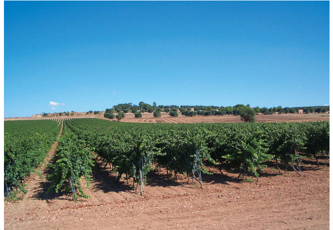
Weinberge von Cantele

Auf der Suche nach preiswerten Weinen aus Süditalien hat uns dieser sympathische Familienbetrieb vollends überzeugt. Das Weingut Cantele wird bereits in dritter Generation geführt. Die Weine von Cantele überzeugten trotz ihrer